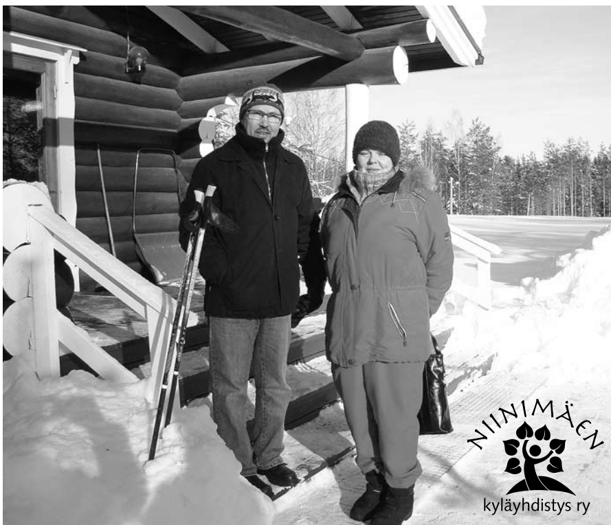
Uusi ja vanha puheenjohtaja talvimaisemassa.

Hallitus on nyt uusiutunut ja luulen, että nyt on aika vetää henkeä ennen seuraavia ponnistuksia. Kehittää leikkikenttää, järjestää yhteisiä tilaisuuksia, kuten suunnitteilla olevaa Pietarin matka Allegrolla elokuussa ja olla mukana Kyläkuituhankkeessa. Tosin vuosikokouksessa jo väläytettiin ajatuksia ”Näkötornihankkeesta”. Saapa nähdä kuinka kauan jaksetaan laakereilla levätä. Olkaa yhteydessä hallituksen jäseniin ideoissa mutta muistakaa, ettei vaan esitetä asioita hallitukselle tehtäväksi, vaan ollaan itse sataprosenttisesti tällöin asiassa mukana.