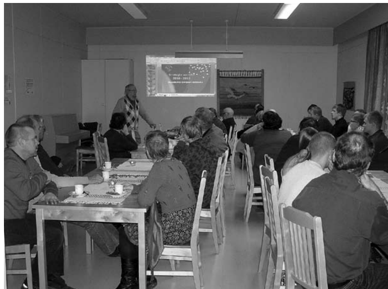
Valokuituinfo Teuroisten kylätalolla.

Valokuituverkko on nähtävä monipalveluverkkona, joka on paljon muutakin kuin pelkkä internet. On huomioitava, että nuoret, jotka lähtevät opiskelemaan, tottuvat käyttämään nopeita tietoliikenneyhteyksiä. He eivät palaa seudulle, jossa ei ole vastaavanlaisia yhteyksiä, vaikka muutoin voisivat työskennellä etänä. Valokuituverkon toteuttaminen osuuskuntaperiaateella on hyvä ratkaisu. Operaattorit ovat monessa tilaisuudessa ilmoittaneet että he eivät aio rakentaa valokuituverkkoa haja-asutusalueille. Osuuskunnan rakentama verkko tulee olemaan avoin kaikille palveluntarjoajille. Tämä merkitsee sitä että kilpailu pitää huolen hintojen järkevästä tasosta. ”Kuvapuhelimet” ovat arkipäivää valokuituverkoissa. Ilmaiset IP-puhelut ovat jo tätä päivää siellä missä