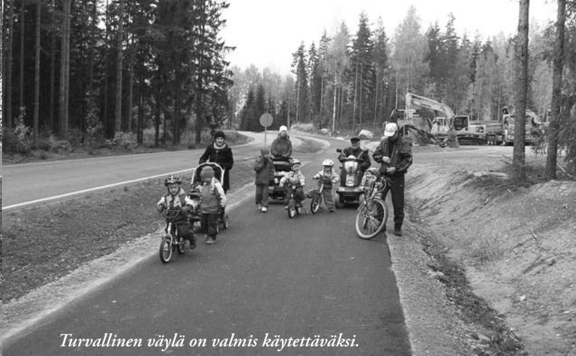
Turvallinen väylä on valmis käytettäväksi.