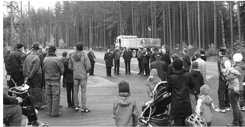
Kukonojantiellä liikenne jyrisi avajaispuheidenkin aikana.

Tämä osoittaa, että missään vaiheessa ei ole annettu periksi vaan aina on keksitty ja laitettu uusia ideoita kehiin. Lisäksi väylähanketta tukivat rahalahjoituksin 27 yritystä ja yhteisöä ja 34 yksityistä