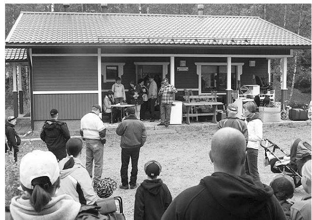
Huutokauppa- ja kirppistapahtuma pidettiin kesäkuussa metsästysmajalla.

Niinimäen kyläyhdistyksen järjestämä tapahtuma onnistui hyvin. Sekä kirpputori että huutokauppa herättivät kiinnostusta. Tapahtuma järjestettiin periaatteella, että kyläläiset tuovat myytäväksi jotakin itselleen tarpeetonta. Tapahtumassa voi nauttia myös kahvion tuotteista ja grillimakkarasta. Tuotto meni kevyen liikenteen väylän hyväksi.