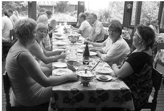
Niinimäen ja Teuroisten retkeläisiä lohikeitolla Kaunissaaren Majalla