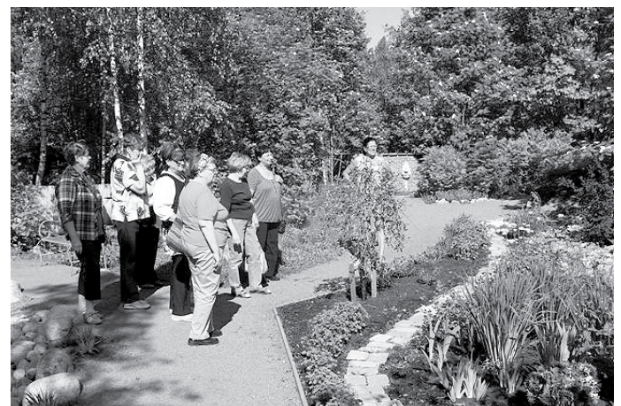
Teuroisten martojen retki Eijas's Gardeniin